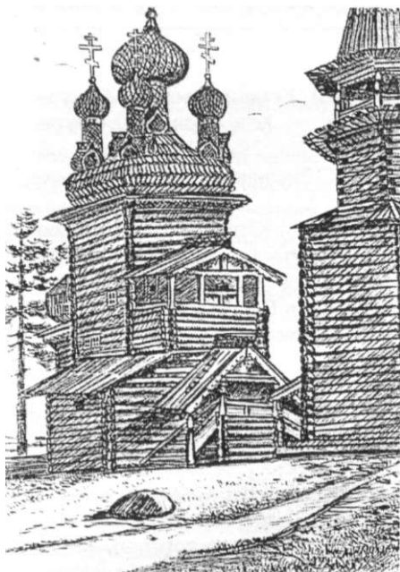
П. Фефилов. Малые Карелы под Архангельском